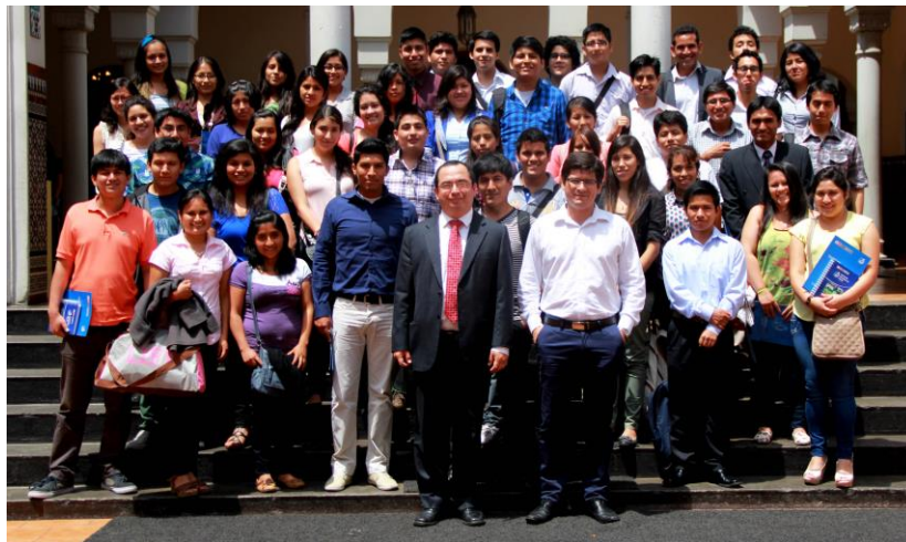
Curso de Inducción para los Practicantes Pre Profesionales I Semestre 2015